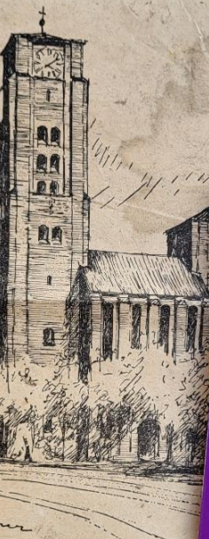
St. Thaddäus-Kirche in Kriegshaber

Dem Namen des Kirchenpatrons des Apostels Judas Thaddäus, suchte ein Spender aus der 1919 für die damals eben errichtete Kirchenflügel zum Bau einer neuen Kirche für das Gelände im Westen des Oberhausener Bahnhofs einen namhaften Geldbetrag stiftete und von dem nur bekanntgeworden ist, daß er ein Offizier aus dem ersten Weltkrieg war. Er verband seine Spende mit der Bitte, gerade diesem Heiligen, dem er sich besonders verbunden fühlte, in der neuen Kirche einen Platz einzuräumen. Von der Spende blieb in der Infaktion nichts übrig — bis auf die gute Meinung des Stifters. Es dauerte noch bis 1938, ehe der erste Seelsorger für die neue Expositur St. Thaddäus ernannt wurde. Als Gotteshaus bekam die neue Gemeinde vorläufig die bisherige Nötkirche von St. Martin, die dort nicht mehr benötigt wurde, und jetzt auf einem gemieteten Platz an der Tunnelstraße wieder eine Stätte fand, um der Gemeinde für sechs Jahre als Unterkirche zu dienen. Nachdem schon 1932 ein Kirchenbauverein gegründet worden war, erhielt 1937 nach dem Ankauf eines Bauplatzes an der Ulmer Straße in einem Architektenwettbewerb der Augsburger Kirchenbauer Thomas Wechs den Auftrag zum Bau der neuen Kirche, die ein