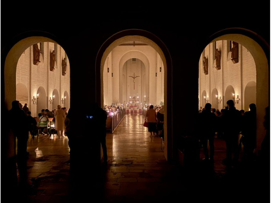
Die Feier der Osternacht - hier in der Pfarrkirche St.Thaddäus. Licht im Dunkeln!