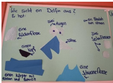
Die „Einzelheiten“ eines Delfins...

Da ein Kind die Frage hatte, wie Delfine atmen, entstand das Interesse auch bei den anderen Kindern. Wir haben gemeinsam herausgefunden, dass Delfine keine Fische, sondern Säugetiere sind und durch ein „Blasloch“ atmen. Kaum war die erste Frage geklärt, entstanden noch viele weitere. So haben wir uns einen kurzen Film über Delfine angeschaut, haben Delfine gebastelt und uns Bücher über Delfine in der Bücherei ausgeliehen. Nun sind wir dabei, Tag für Tag immer mehr Antworten auf unsere Fragen und damit Wissen über Delfine zu erlangen.