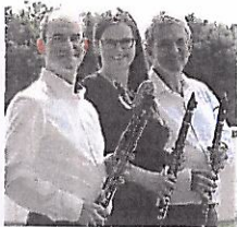
Klarinetten trio Clari-o-ton

Klarinetten trio Clari-o-ton Zither 3+ Christian Dreigesang Merchingen Stubenmusik